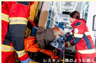
レスキュー隊のように働く

この時「現状のスタッフは行動するのに少し時間がかかるよね」という話も出ました。「まずは自分から一歩踏み出す、そんな集団になりたいね」と。理想を描いた時、現在足りない要素を補うためにメッセージやカラーを設定する、これがブランディングの考え方です。 振り返ると、社名の「信幸プロテック」にもともと「PROTECT」も「PRO」も「TECH」も「PROTECT」守るの3つの意味が込められています。 つまり、社名を付けた時から、高度な技術で地域の企業活動、暮らし、環境を守ることを使命としていたのです。 「コーポレートカラー」一歩を踏み出す勇氣とパワーをくれる「レスキューレッド」