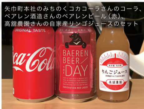
矢巾町本社のみちのくコココーラさんのコーラ、ペアレン酒造さんのペアレンビール(赤)、高館農園さんの自家産りんごジュースのセット