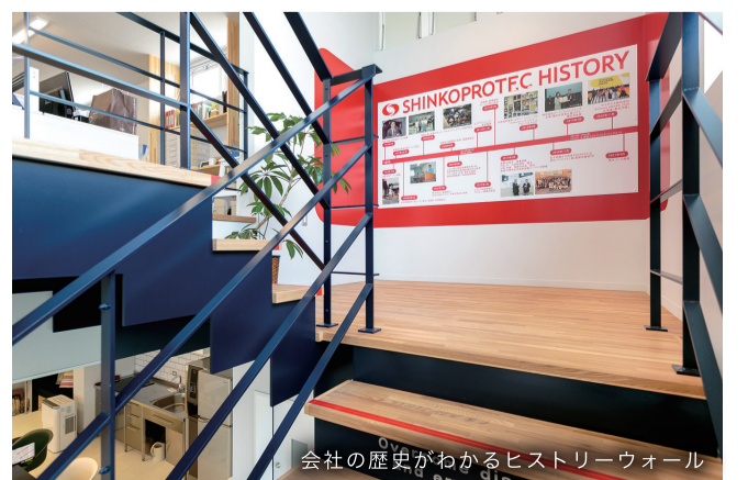
会社の歴史がわかる歴史ウォール