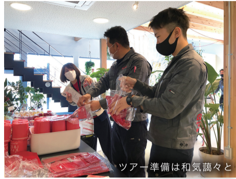
ツアー準備は和気藹々と

4月27日・28日・30日の3日間で新オフィスの見学ツアーを開催しました。岩手県内の方に限定し、完全予約制・人数制限・消毒・換気と感染対策を万全にしての開催となりました。会場には県外からもオープンを祝うたくさんの観葉植物やお花が送られ、たくさんの自然に囲まれた爽やかでフレキシブルな空間に、多くのお客さまや関係業者の皆さまから応援頂いていることが実感できる3日間でした。