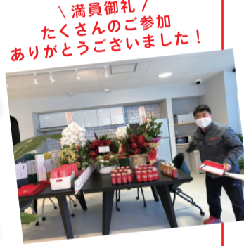
スタッフお揃い赤シャツ

ツアー参加者へのお土産は「レスキューレッド」カラーのセット(エコバッグ・トイレトペーパー・ドリンク・家族の避難所マグネット)を！