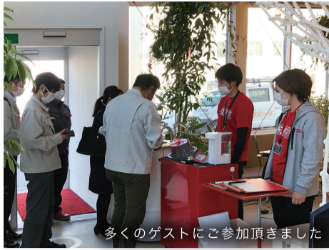
多くのゲストにご参加頂きました