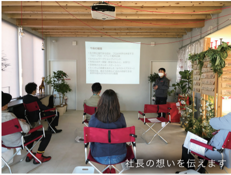
社長の想いを伝えます