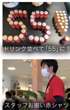
ドリンク並べて「55」に！