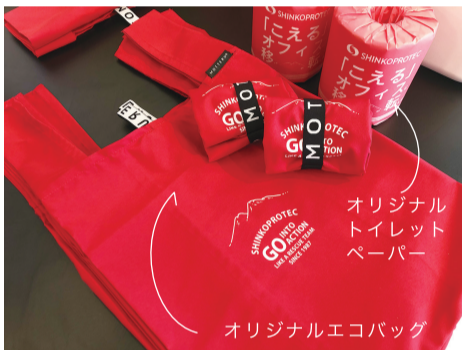
オリジナルエコバッグ

北上市にイチゴ狩りに行ってきました。広いハウスの中は明るく清潔で摘みやすく、『べにほっぺ』『おいCベリー』『恋みのり』の3品種がありました。摘みたてはとても新鮮で、40分の時間制限でも沢山食べられました。