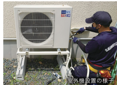
室外機設置の様子

今号は蓄熱暖房機 エアコンにすることを床置きエアコンに、元々設置していた更新した事例をご紹介します。場所を活用できるの紹介です。 蓄熱暖房機が元々 なく済みます。置いてあった場所に、床置きエアコンは床置きエアコンの室内風が下から吹き上げ内機を設置し、新たにるので、夏は涼しく、エアコンの室外機を 冬は足元が温かいメ屋外へ設置しました。 リットがあります。 壁掛のルームエア ご興味のある方はコンではなく床置き お問合せください。