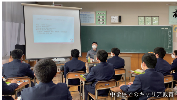
中学校でのキャリア教育

学校では日頃から、インターンシップや学校でのキャリア教育、しごと体験などの機会を積極的に設けるようにしています。 以前は受け入れる準備が不十分で戸惑うことも多くありましたが、少しずつ私たちの仕事を自分の言葉で話せるようになったり、地域で働きたいと思える仕事をつくり、そのような企業になることは、最大の地域貢献にもなります。 将来を担う世代から見て少しでも魅力的に映り、ここで働きたいと思える。そんな会社になるために一歩ずつ進んでいきたいと思っています。