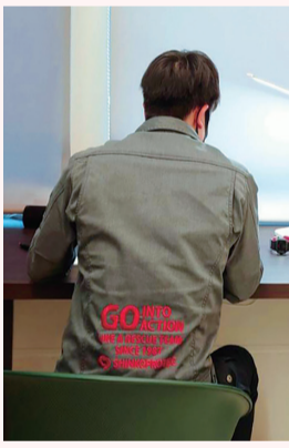
終業後に資格の勉強をするスタッフ

今号は「自分を超越る」取り組みをご紹介します。 ① 経営指針発表会 毎年度始めに、部門、個人の年間計画の発表会をしています。特に個人の発表では仕事面での目標や資格取得の計画、プライベートでの目標などを全スタッフの前で発表します。 ② 資格取得支援 合格時に受験料が全額支給される制度や、資格手当があります。各々が目標に掲げた資格の取得に向けて、仕事の合間を縫って勉強しています。新社屋に移転してから、1Fのオープンワークスペースで勉強しているスタッフもいます。 ③ アンコール60 現在60歳以上のスタッフが4名います。人生の大先輩から知恵を借りて、知識や技能を高めることができます。 ④ 年3回ボーナス 夏・冬・期末の年3回賞与を頂く機会が、日々の努力でこれまでの自分を超越られた証になります。