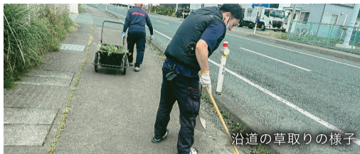
沿道の草取りの様子

今回は、6月17日に実施した清掃活動について紹介します。地域貢献活動の一環として、毎年行っています。日程を聞いた当初は、まだ涼しい時期だと思っていたのですが、今年からは暑くなるのが早く、朝から日がガンガン照っております、とても暑かったです。私は空調服を着て行いましたが、空調服無しでは作業が大変だなと感じました。