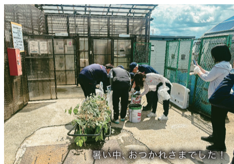
暑い中、おつかれさまでした!

総勢10人くらいで、会社の周辺や旧事務所内を中心に、3グループに分かれて沿道の草取り・ゴミ拾いなどを行いました。草が伸びて生い茂っている所もあり、そういった除草作業の手が入らない所にはゴミのポイ捨てが目立ち、定期的な除草作業も大切だと思いました。また、日常生活の中でゴミがあったら拾うなど、一人ひとりが意識していけば、少しずつ